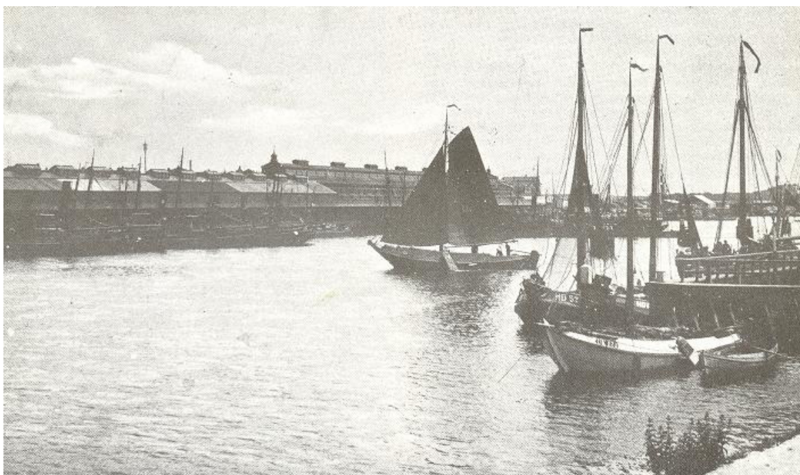
IJmuiden in de tijd, toen het ook thuishaven was voor Volendammer kwakken, die op de Noordzee visten.